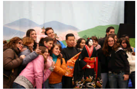
平成19年12月イタリア公演